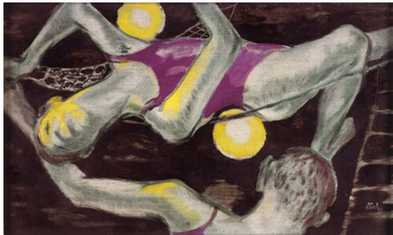
Paul Strecker, Garten mit Frau und Kind , (Detail), ca. 1946, Aquarell auf Papier © Paul-Strecker-Stiftung Mainz