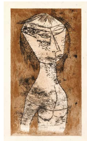
Paul Klee, Die Heilige vom inneren Licht, 1921 © Lindenau-Museum Altenburg