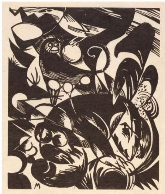
Franz Marc, Schöpfungsgeschichte I, 1914