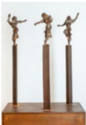
Karlheinz Oswald: Triade / Rheintöchter, 2000, Eisen, erworben 2023 mit finanzieller Unterstützung des Vereins der Freunde des Landesmuseums Mainz e. V.