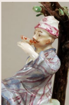
Höchster Porzellanmanufaktur, Teetrinkender Chinese, um 1750-1755, erworben mit finanzieller Unterstützung des Vereins der Freunde des Landesmuseums Mainz e. V.